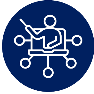
Eğitim ve Danışmanlık

Weex temelde Amazon'a yönelik resmi süreçler ve operasyonel alanlarda uçtan uca çözüm sunan global bir ağıdır.