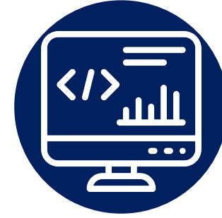
Yazılım ve Stüdyo