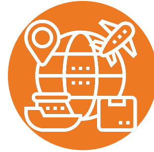
Kargo ve Lojistik Süreçler