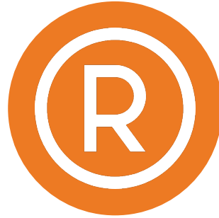
Markalaşma ve Tescil İşlemleri