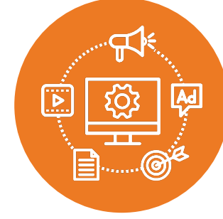
Dijital Pazarlama ve Lansman